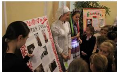
Информационная выставка «СССР: образ дружбы»