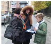
Акция «Открытие любимому учителю»