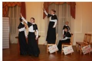
Спектакль «Ради семьи»