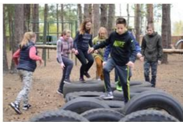
Военно-патриотическая игра «Сестринский рубеж»