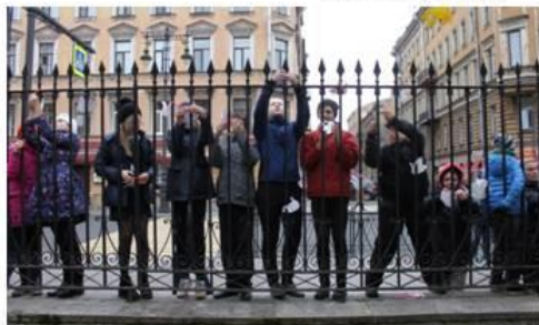
Акция «Голубь мира»