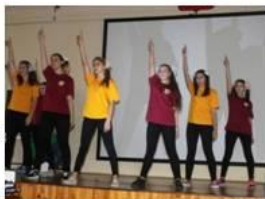
Концертно-творческая программа «Снимается кино»