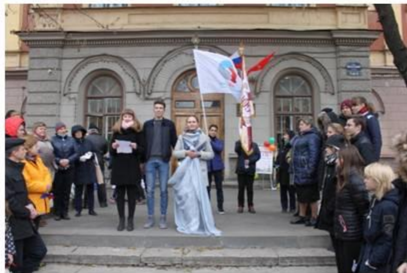
Акция «Голубь мира»

Для проявления общественной активности нужны высокие задачи, которые лежат в плоскости просветительства и заботы, сотрудничества и служения.