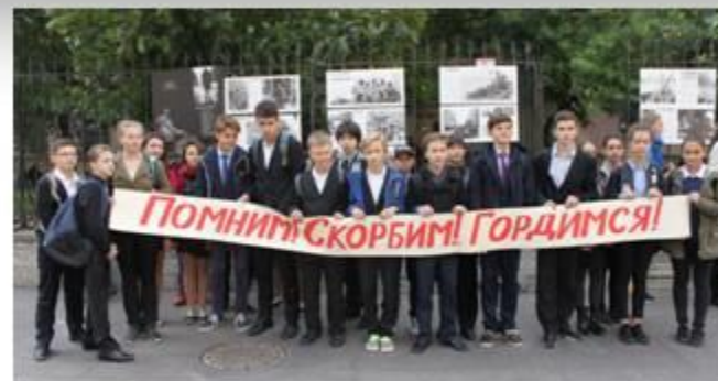
Акция «Помним. Скорбим. Гордимся»

Ведущая задача ГБОУ гимназии № 209 «Павловская гимназия» - создание условий для воспитания многогранной созидающей личности посредством приобщения к истории и традициям Отечества.