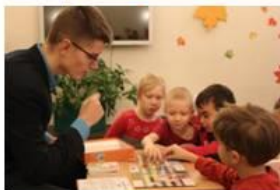
Урок безопасности для мальшей