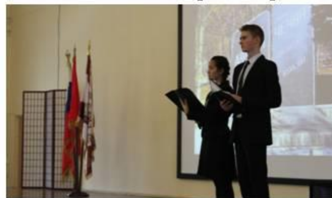
День героев Отечества