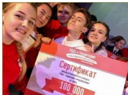
Призеры Всероссийского фестиваля «РДШ – территория самоуправления»