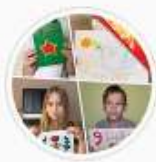
Подарок к ...